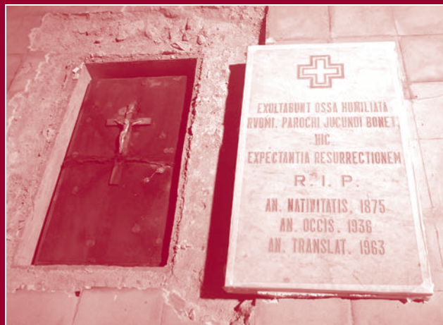
Tomba i làpida, abans de ser exhumades les restes. Capella de la Sagrada Família.