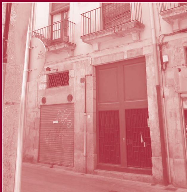
La casa on va néixer el Beat Jocund, carrer La Nau 7, Tarragona.